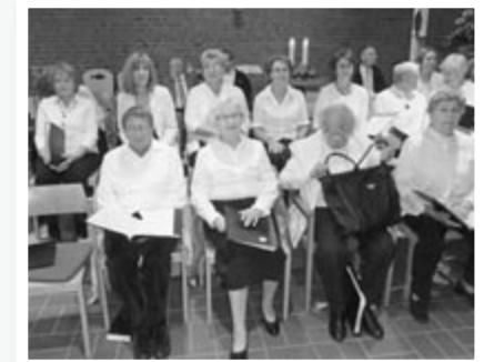
Die Stimme gut geölt, die weiße Bluse gebügelt, die letzten Noten geordnet: Mitglieder der St.-Petri-Kantorei vor der festlichen Sommermusik am 3. Juli