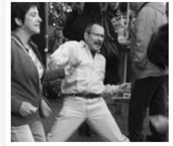
Da muss einfach getanzt werden: Gute Laune und nette Leute beim Jubiläumstalk