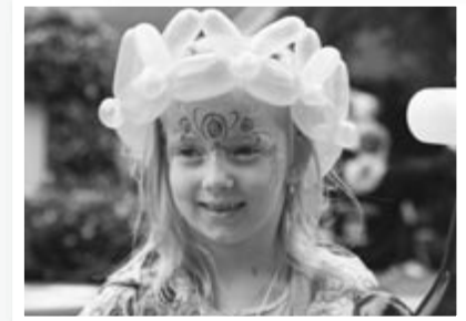
Strahlende Gesichter trotz sehr durchwachsenem Wetter beim Kinder-Straßenfest