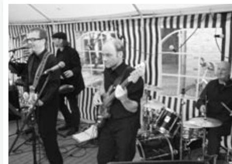
Stimmung pur aus fünf Jahrzehnten: Kein Problem für die Band „No Problem“ beim Jubiläumstalk-am-Turm am 24. Juni