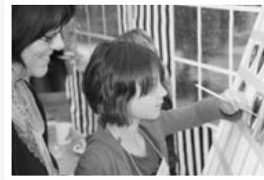
Ein Herz für St. Petri: Am Malstand auf dem Kinder-Straßenfest am 25. Juni entsteht ein Herz-Gemälde