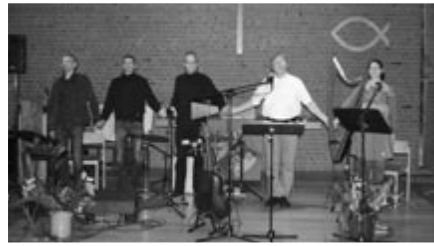
Ein bewegendes Konzert geht zuende: Die Studiogruppe Baltruweit beim brausenden Schlussapplaus