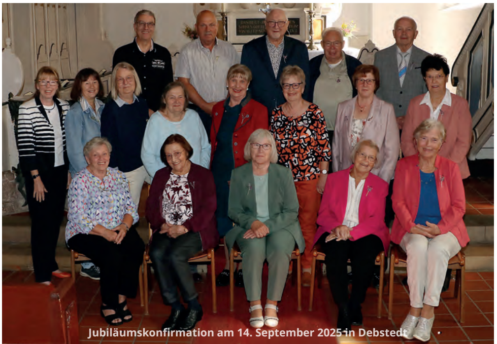
Jubiläumskonfirmation am 14. September 2025 in Debstedt